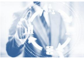
СХЕМА РОБОТИ ПРРО